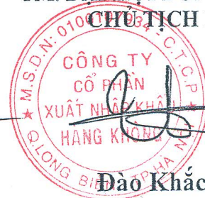
Đào Khắc Hậu